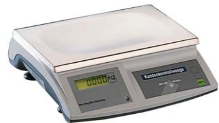
RN10- CWRS Tömegkijelzős mérleg