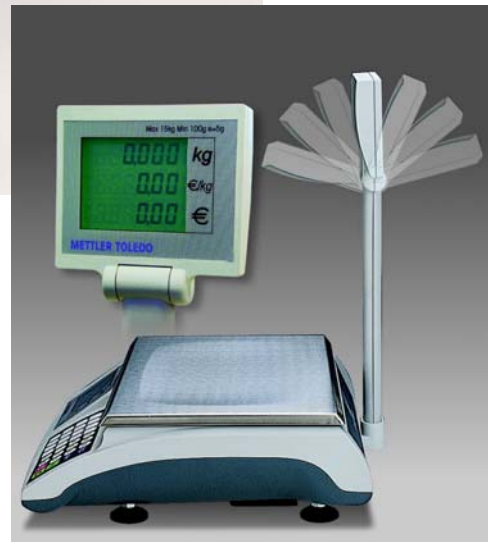
RN10-CNTRS- Árszorós tornyos mérleg