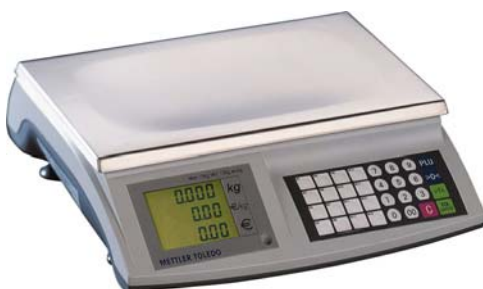
RN10- CNRS Árszorós mérleg